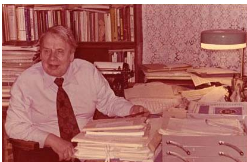
Б.В. Гнеденко за своим письменным столом (конец 70-х).

Я хотел бы начать небольшую серию воспоминаний с истории, которая характеризует Бориса Владимировича Гнеденко не только как блестящего ученого и замечательного педагога, которого многие знают по его многочисленным книгам и статьям, но и как удивительную личность – принципиальную и смелую.