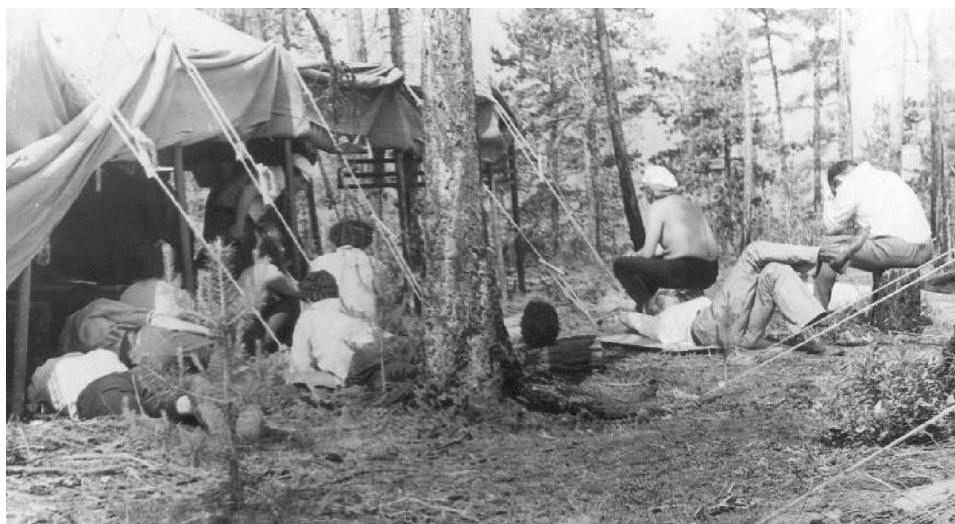
«Конференц-зал» (семинар на Ольхоне)

Рано утром поехали в Листвянку, а оттуда на институтском «крейсере» на остров Ольхон. Там уже разбит палаточный лагерь, и «конференц-зал» – тент, под которым размещались, прячась от жаркого летнего сибирского солнца, «конференнты».